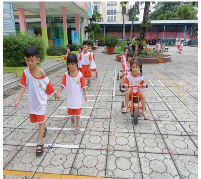
Bé tập đi bộ trên vạch kẻ

- Trong lớp nhà trường trang bị cho giáo viên một số thiết bị như: ti - vi, máy vi tính, dụng cụ để trẻ làm thí nghiệm, tranh ảnh, lô tô... Bên cạnh đó cô trang trí môi trường lớp cho trẻ trong các góc theo nội dung cần học, thay đổi theo từng tuần, bố trí sắp xếp đồ chơi cho trẻ tự do khám phá, sưu tầm tranh ảnh, làm đồ dùng, đồ chơi về các sự vật hiện tượng tự nhiên, xã hội để trẻ làm quen và hoạt động trải nghiệm về