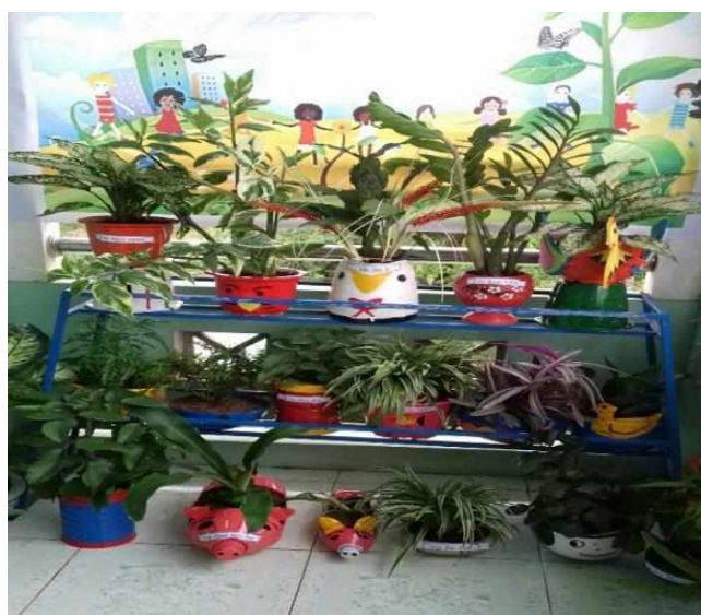
Góc thiên nhiên ở lớp