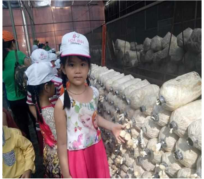
Bé tập hái nấm