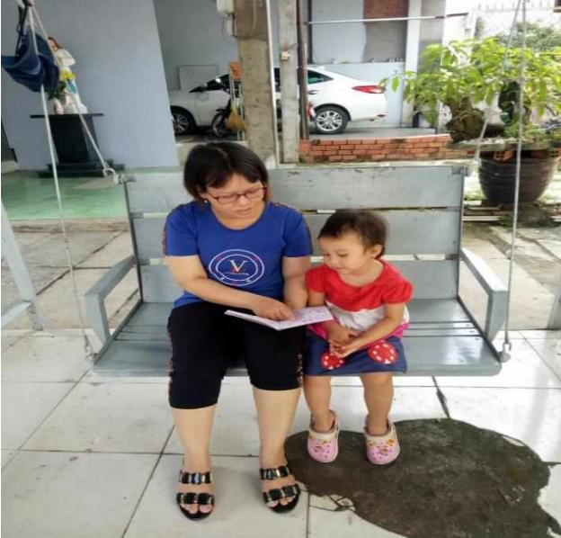
Phụ huynh đọc sách cùng con

- Giáo viên cần kết hợp với phụ huynh, để phụ huynh cùng trẻ tìm hiểu, sưu tầm tranh ảnh, phụ huynh có thể giúp con khám phá vấn đề trẻ hỏi, hoặc giáo viên yêu cầu, nhờ phụ huynh cùng trò chuyện với trẻ về bài học để cho trẻ học tập tốt hơn trong giờ học.