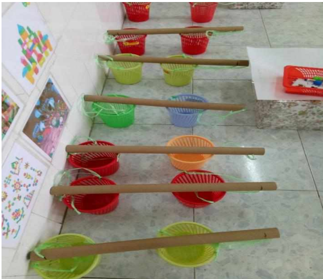
Quang gánh cho trẻ thu hoạch sản phẩm nghề nông