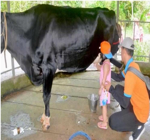
Bé tập vắt sữa bò