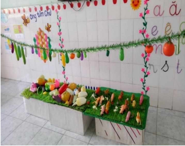
Tìm sản phẩm của nghề nông