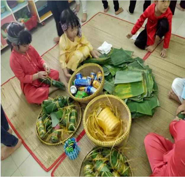
III. K Phụ huynh ủng hộ vật liệu để trẻ gói bánh ngày tết

Phụ huynh đã đóng góp tùy tâm để trẻ được vui hơn khi phá cỗ, liên hoan, đóng góp kinh phí để cho trẻ chơi gian hàng ngày tết. Khi phụ huynh quan tâm đến lớp, mua sắm đầy đủ đồ dùng, dụng cụ học tập phục vụ cho con, giữa cô giáo và phụ huynh luôn có sự gần gũi, cởi mở khi trao đổi các hoạt động của con trên lớp.