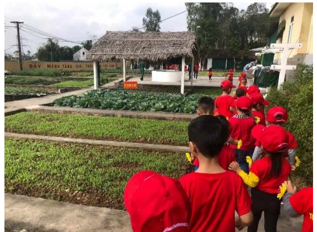
Bé tham quan doanh trại bộ đội