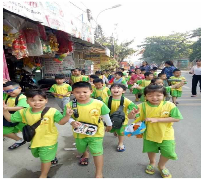
Bé đi siêu thị

- Cho trẻ tham quan di tích lịch sử Ngã Ba Giồng để trẻ hiểu thêm về truyền thống yêu nước của dân tộc, thể hiện lòng biết ơn, kính trọng các anh hùng chiến sĩ đã hi sinh cho đất nước. Hiểu thêm về quê hương Hóc Môn “18 thôn vườn trầu” nhưng đậm đà nghĩa tình quân dân, che chở, đùm bọc các chiến sĩ.