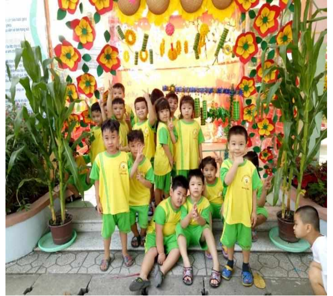
Phụ huynh ủng hộ hoa mai, đào để trang trí tết