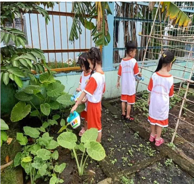
Bé chăm sóc vườn rau

Nếu trẻ có được môi trường phong phú, phù hợp, an toàn thì sẽ giúp trẻ mở mang hiểu biết, có điều kiện để hoạt động tìm tòi khám phá và phát hiện những điều mới lạ xung quanh. Để tạo môi trường cho trẻ làm quen với môi trường xung quanh, nhà trường tạo môi trường để trẻ khám phá như: trồng các loại cây xanh, cây ăn quả, các loại hoa, nuôi một số con thú, xây dựng vườn cây của bé có các loại hoa và rau khác nhau, để trẻ được quan sát, chăm sóc và khám phá mỗi khi dạo chơi ngoài trời.