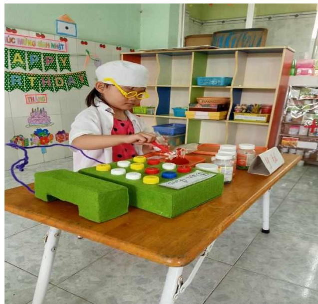
Bé làm bác sĩ

- Ở lớp, tôi xây dựng góc thiên nhiên cho trẻ. Đây là nơi dành cho các hoạt động chăm sóc cây cối: nhặt cỏ, bắt sâu, tưới nước, trẻ tự trồng cây và theo dõi quá trình phát triển của cây. Ngoài ra còn là nơi trẻ tìm đọc các loại sách về thiên nhiên. Khi các bé tự tay gieo hạt các bé sẽ khám phá về quá trình phát triển của các loại cây và làm quen cách thức trồng cây xanh.