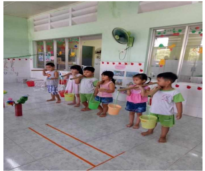
Trẻ đi theo đường hẹp, vượt chướng ngại vật để thu hoạch sản phẩm