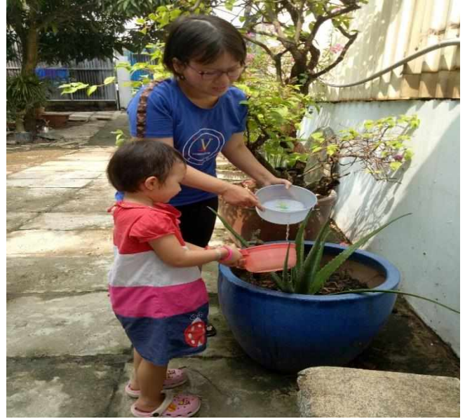
Phụ huynh cùng trẻ chăm sóc cây

- Phụ huynh cũng có thể ủng hộ lớp những đồ dùng để dạy môi trường xung quanh, hay ủng hộ cây xanh cho góc thiên nhiên. Trước khi dạy một đề tài nào tôi thường xuyên trao đổi với các bậc phụ huynh để phụ huynh hỗ trợ vật liệu, đồ dùng nếu có thể.