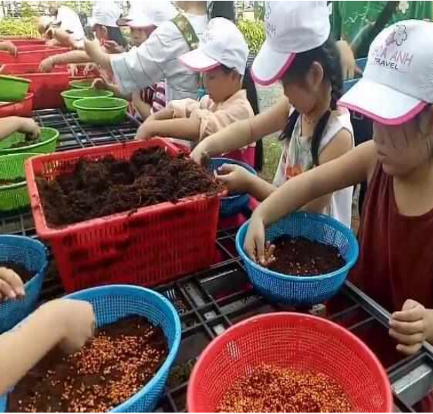
Bé tập trồng giá