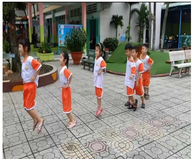
Trẻ bắt giống ếch